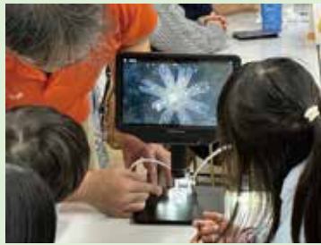
▲顕微鏡でエフィラのお食事の様子などを観察

参加者アンケートには絵入りの感想や感謝の言葉が記されていて、大変うれしく思いました。運営のサポートをいただいた職員およびボランティアの皆様にもこの場を借りてお礼申し上げます。(里見)