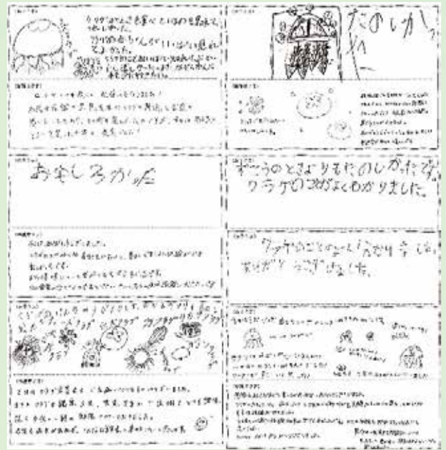
▲終了後には素敵なメッセージをいただきました