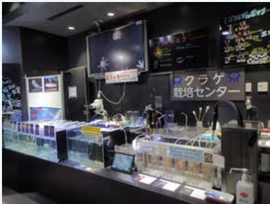
▲この場所で「クラゲのおはなし」を実施していました。

臨時休館してすぐに解説コーナーのクラゲたちの引越しが行われました。この場所では比較的小さなクラゲたちを小型の水槽で数多く展示していました。たくさんの水槽をいそいそ取り出して、みんなでせっせと新棟の展示室へと運び入れます。もともと4つの温度で管理していたので、引越し先で温度を間違えないように設置です。すべて移動した後はちょっとひと息…とはいかず、クラゲたちが心地よく漂えるように水流調整です。そして残された飼育機器をきれいに掃除して裏にしまい込みます。よし、終了!!と、満足して何もなくなった解説コーナーを見て、寂しさも感じつつも新しく生まれ変わる展示室を想像してワクワクも同時にこみ上げてくるのでした。(佐藤)