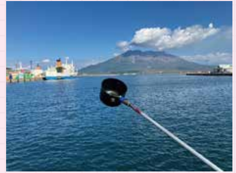
▲桜島に見守られながらの採集

加茂水族館ではポリプから繁殖させたタコクラゲを展示していますが、野生個体ほど大きくなることはありません。また、野生個体は口腕付属器も立派に生えており、やはり繁殖個体とは迫力が違うなあと思われ知らされました。 クラゲを飼育している方々との交流は貴重であり、大変有意義な時間を過ごさせてもらいました。 他園館さんとのつながりの心強さをかみしめながら帰路につきました。いつか野生個体に負けないような立派なタコクラゲを展示したいものです。(久保)