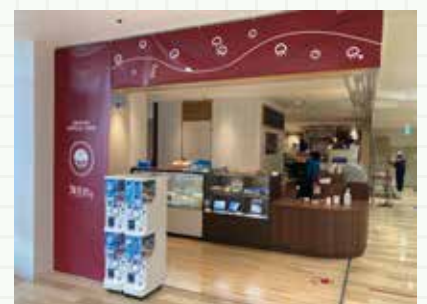
▲海月灯りでは厳選した商品を取り扱う