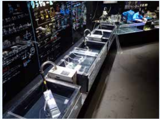
▲どんどん運ばれていき、空になっていく水槽