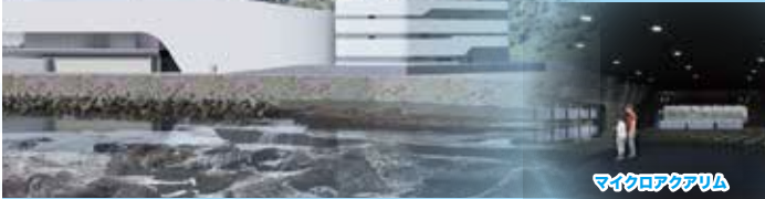
マイクログラフィア