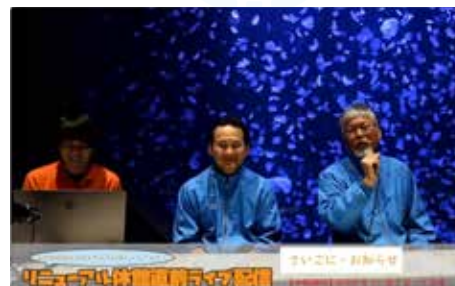
▲ライブ配信の様子

10月31日の閉館後にクラゲドリームシアター前で「休館直前ライブ配信」を行いました。トークライブは水族館公式YouTubeチャンネルで配信し、会場にも一般のお客さまも観覧していただきました。トークライブには館長とクラゲ担当の飼育員が参加し、休館目の想いやリニューアル後の水族館がどのようになるのかを話していきました。話の中では新棟施設の一部を公開し、トークライブでしか聞くことができないものとなりました。(玉田)