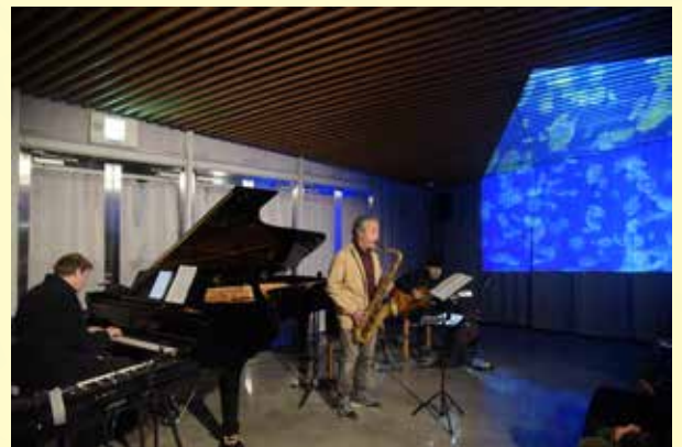
▲休館中の「音楽のタベ」は荘銀タクト鶴岡で開催。クラゲ水槽を上映し水族館らしさを演出。