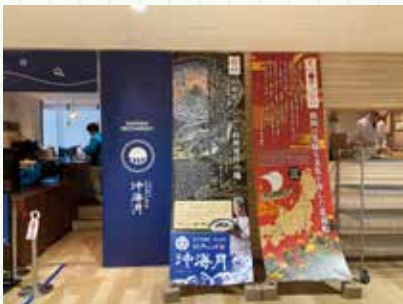
▲沖海月入口にかっこいいタペストリーを設置

リニューアル工事のため休館となり、レストラン「沖海月」やグッズショップ「海月灯り」もお休みとなります。そんな折、鶴岡駅前の「つるおか食文化市場 FOODEVER (フードバー)」にて、レストラン跡地が空いているので、休館中に沖海月が出店してはというお話をいただきました。鶴岡駅前の販わい創出、加茂水族館のPRにも一役買えるかな、せっかくだから海月灯りも出店しようと思いましたが、新たにお店を出すのはとても大変ですね。次から次へとやるべきことが出ててもうてんやわんやでしたが、何とか12月1日プレオープン、6日に無事グランドオープンを迎えることができました。皆さん足を運んでいただけましたでしょうか!?(渡辺)