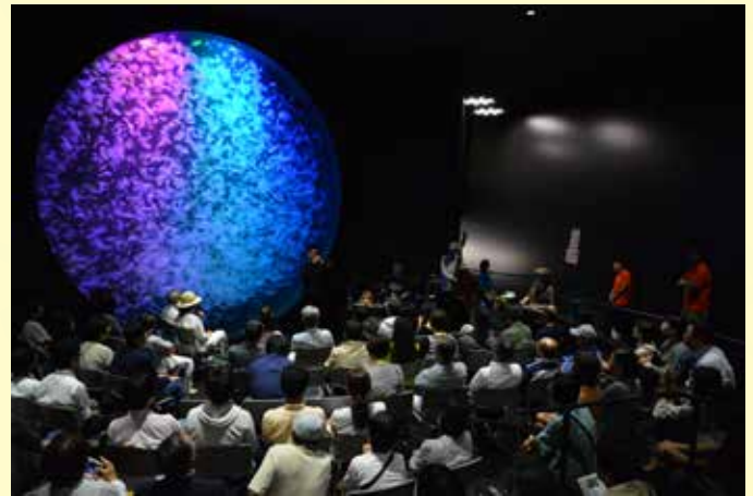
▲「音楽のタベ」初回「磯見カルテット」の様子

そして2026年3月をもちまして一区切りとし、終了いたします。8年間にわたり支えていただいた皆様へ心より感謝申し上げます。現在は休館中のため会場を「荘銀タクト鶴岡」に移し、開催しております。残すは2026年2～3月の2回となりました。最後まで心を込めて開催してまいります。「音楽のタベ」は終了いたしますが、今後も皆様により一層楽しんでいただけるイベントをお届けできるよう努めて参りますので、ご期待ください(香焼)