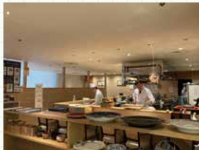
▲調理の様子が見えるオープンキッチン仕様