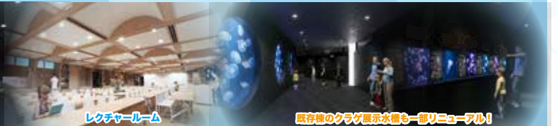
レクチャールーム