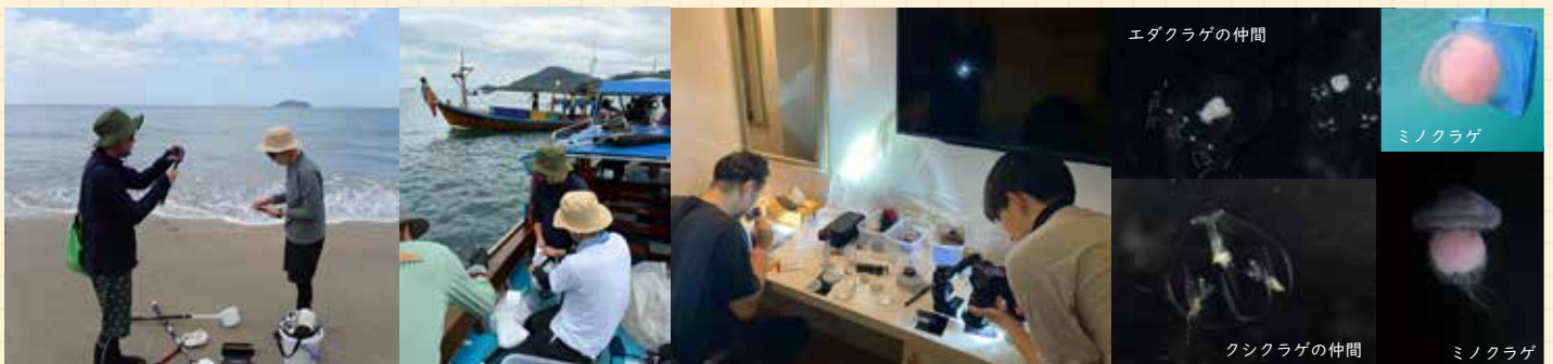
▲採集は砂場や港、乗船などさまざま！

日本に戻ってからはクラゲが冷えすぎないようにケアをしながら水族館へ搬入し、搬入後はクラゲについての寄生虫などを駆除しました。まずは水族館に無事に搬入できたので4月のリニューアルオープンまでに大きく育てて皆さんに見ていただきたいです。ご来館された際はミノクラゲにも注目して見てください！（玉田）